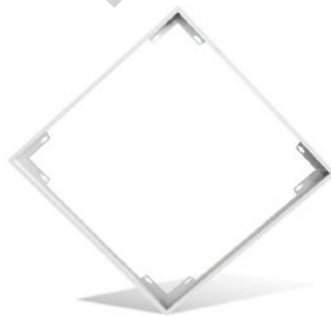
Rám pro přisazenou montáž