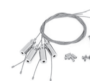
Lankové závěsy Hanging cables Cable de suspensión