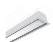
Rámeček pro zakrytí niky Niche frame Marco para lámparas empotradas